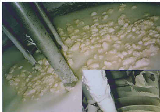
Rys. 2.: Substancje lepkie i tworzące grudki stanowią częsty problem.

Proces tworzenia emulsji składa się z dwóch faz: „mechanicznego rozdzielania” i elektrochemicznego pokrycia powierzchni kropelek”. Pierwsza faza zachodzi przeważnie za pomocą sił tnących, w drugiej fazie emulgator jest jak najszybciej odpowiednio dozowany na świeżo wytworzone kropelki. W ten sposób jego ładunek elektryczny zmienia się tak, że micelle przestają się przyciągać. W celu otrzymania trwałej emulsji należy przedtem wytworzyć jak najwięcej małych kropli o odpowiedniej powierzchni